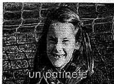
Personas de diferentes edades y profesiones expresan sus deseos.